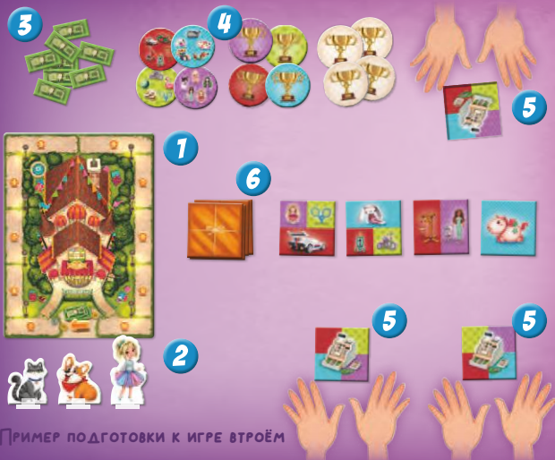
ПРИМЕР ПОДГОТОВКИ К ИГРЕ ВТРОЁМ

ПЕРЕД ПЕРВОЙ ИГРОЙ АККУРАТНО ВЫДАВИТЕ ВСЕ КАРТОННЫЕ КОМПОНЕНТЫ ИЗ ЛИСТОВ. ФИШКИ ПЕРСОНАЖЕЙ ВСТАВЬТЕ В ПЛАСТИКОВЫЕ ПОДСТАВКИ.