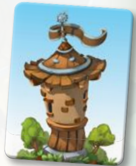
Значок сторожевой башни

Выполнив это действие, откройте новую карточку сверху стопки леса и добавьте её к открытому ряду, в котором всегда должно быть открыто 4 карточки. Если стопка леса опустела, игра продолжается до тех пор, пока не будут выбраны все карточки из открытого ряда.