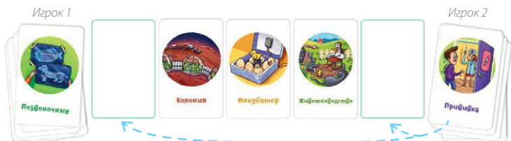
Рис. 2. Карты можно выкладывать только к крайним картам ряда.

Раздайте игрокам по пять карт и две карты положите в центр стола лицом вверх. Игроки ходят по очереди. В свой ход нужно найти среди своих карт такую, которая будет как-то связана с одной из крайних карт, лежащих в ряду на столе. Затем выложить её рядом с этой картой, при этом обязательно объясняя их взаимосвязь. Подкладывать можно только к крайним картам ряда (рис. 2).