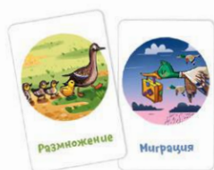
Рис. 3. Эти карты похожи тем, что на них птицы.

Если ходящий игрок предлагает совсем негодную ассоциацию, другие игроки вправе не принять её. В этом случае ходящий должен предложить другой вариант или забрать обратно выложенную карту и пропустить ход.