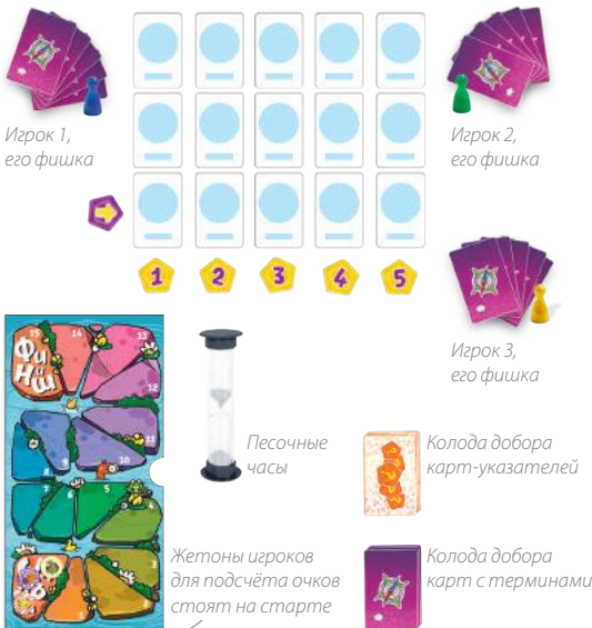
Рис. 1. Первоначальная раскладка.

Игроки получают по фишке и жетону для подсчёта очков (одинаковые по цвету), берут по 5 карт с терминами из колоды добора. Жетоны подсчёта очков ставят на старт на специальном поле внутри коробки. Жетон со стрелочкой, песочные часы, жетоны для подсчёта очков и колода с картами-указателями рубашкой вверх также выкладываются на стол — они понадобятся в процессе игры (рис. 1).