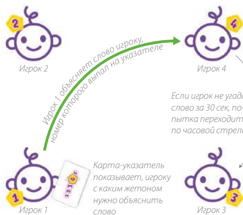
Рис. 4. Если игрок не смог угадать слово за 30 сек, попытка переходит следующему игроку по часовой стрелке.

5. Ход переходит к следующему игроку в двух случаях: