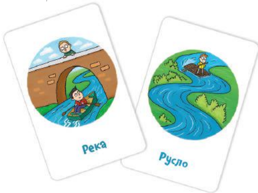
Рис. 5. Например, эти карты похожи тем, что на них мальчик плывёт по реке.

Если игрок не может найти у себя подходящую карту или не может объяснить, как карты связаны между собой, то он пропускает ход.