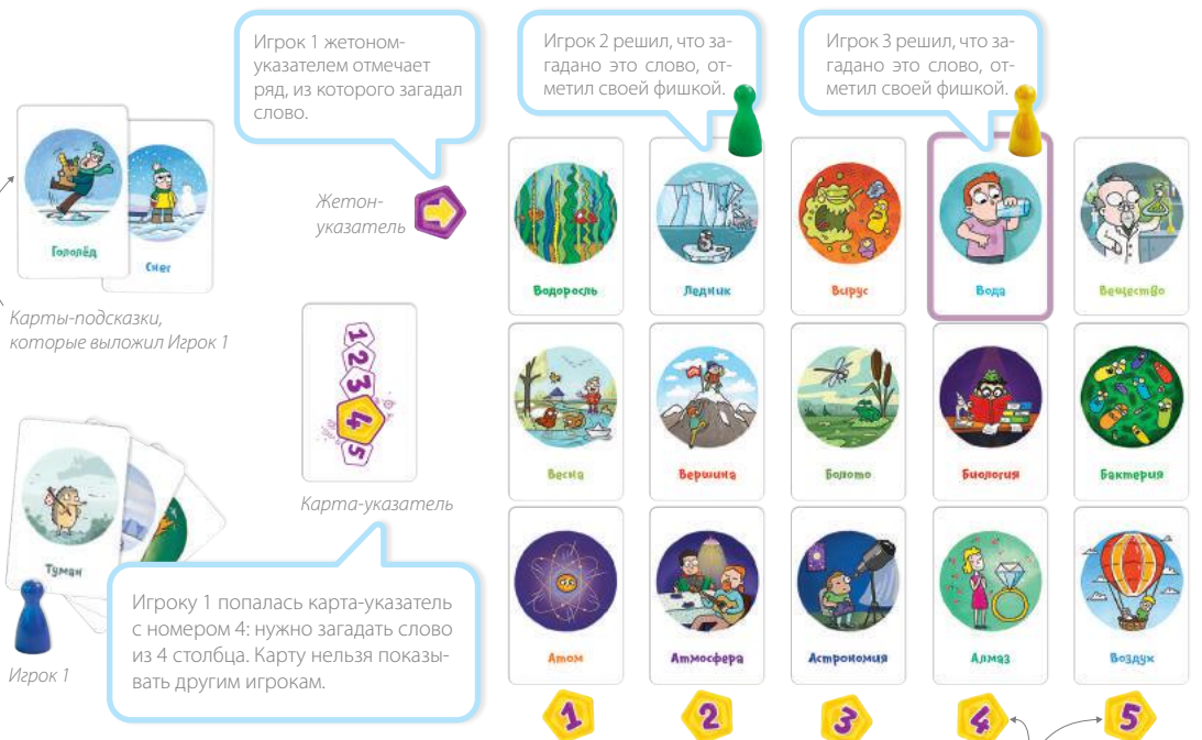
Рис. 2. Общий вид игрового процесса.

Игрок 1 сумел загадать термин так, чтобы кто-то угадал его, а кто-то нет — зарабатывает 2 очка. Игрок 2 не угадал слово — не получает очки. Игрок 3 угадал слово — зарабатывает 1 очко.