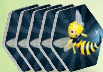
5 жетонов ос