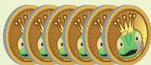
30 жетонов вкусняшек