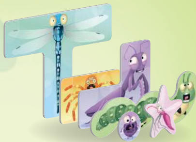
30 жетонов насекомых (по шесть пяти цветов)