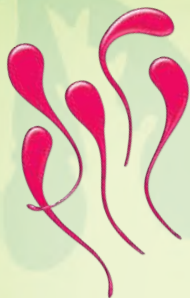
8 липких языков (включая 2 запасных)