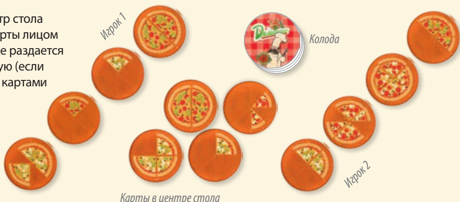
Карты в центре стола

В начале игры в центр стола выкладываются 4 карты лицом вверх, игрокам также раздаётся по 4 карты в открытую (если игра ведётся только картами с одной точкой, то раздаётся игрокам и выкладывается в центр по 3 карты).