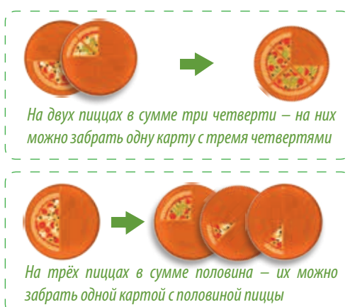
На двух пиццах в сумме три четверти – на них можно забрать одну карту с тремя четвертями

На одну свою карту игрок может забрать две или больше карты из центра, или, наоборот, на две или несколько своих карт он может забрать одну карту из центра. Забирать одной картой одну карту нельзя. При этом количество пиццы на карте (картах), которыми игрок ходит, должно быть равно количеству пиццы на карте (картах), которые он забирает. Виды пицц по ингредиентам в этом варианте игры значения не имеют.