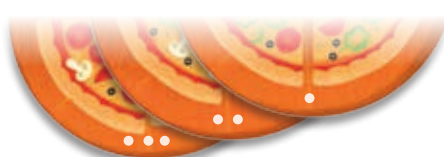
Сложность карт отмечена точками

В игре используются только круглые карты с пиццей. Сложность игры можно варьировать, отбирая карты соответствующей сложности: для начала лучше отобрать только карты с одной точкой, потом постепенно добавлять в колоду карты с двумя и тремя точками.