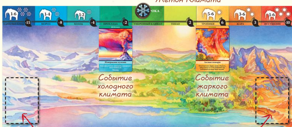
Колода холодного климата