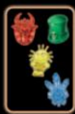
Большая Вуду колода

1) Изучить 3 карточки в руке в поисках недостающего ингредиента и цвета. Осматривайте обе стороны карточек! Если правильный ингредиент нужного цвета найден, игрок кладёт карточку с ним наверх Вуду колоды и громко называет его вслух. После этого игрок берёт верхнюю карточку из своей маленькой колоды, чтобы на руках у него снова оказались 3 карточки. Игра не прерывается.