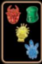
Большая Вуду колода