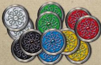
12 жетонов экстрасенсов