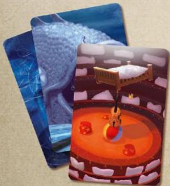
84 карты снов