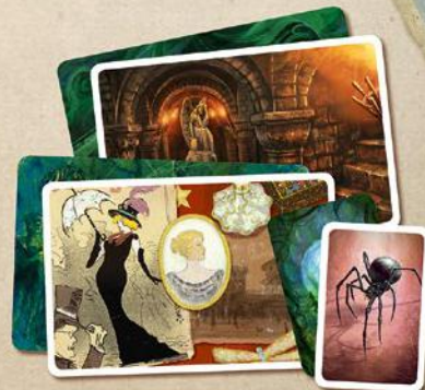
54 карты призрака