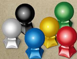
6 магических шаров