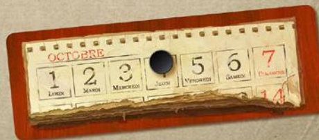
Планшет календаря Фишка дня недели