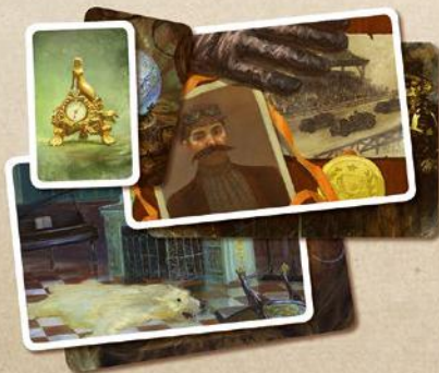
54 карты экстрасенсов